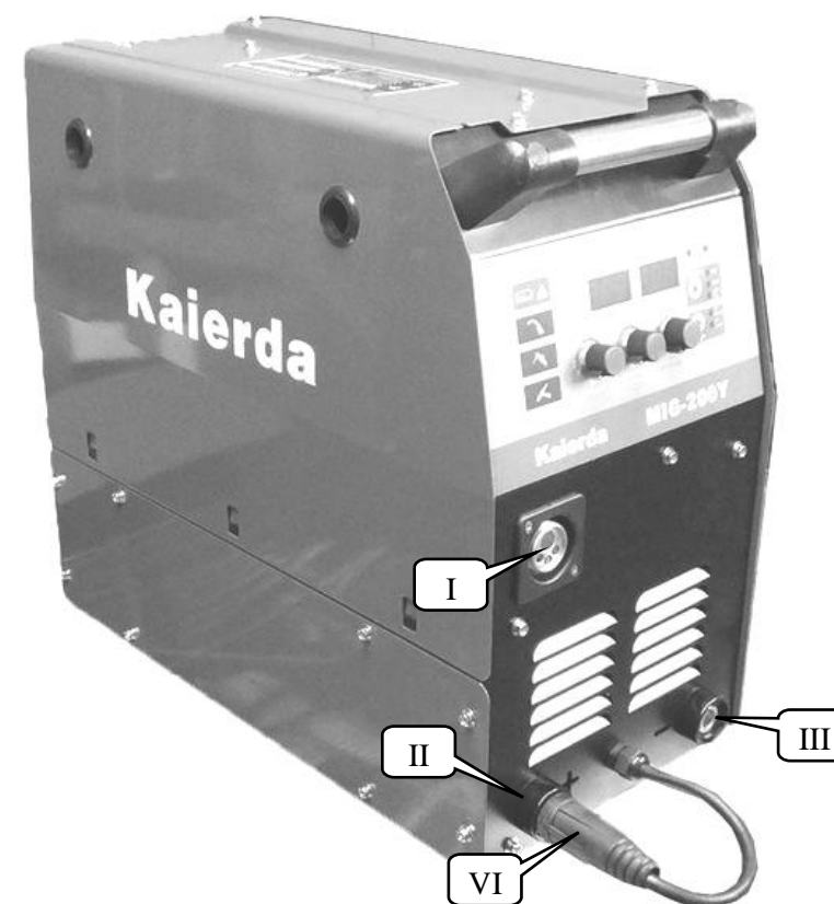
Рис. 1. Расположение выходных разъемов